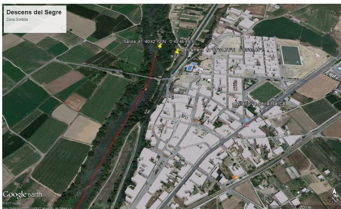
Punt de sortida: zona aparcament vehicles