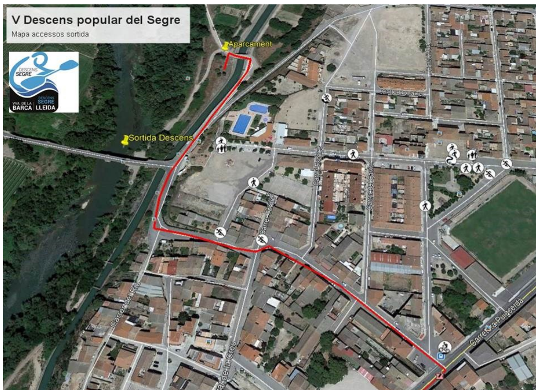
Punt de sortida: Pont del riu (Vilanova de la Barca)